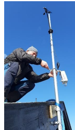
Figur 1: Montering av værstasjon på Stjørdal